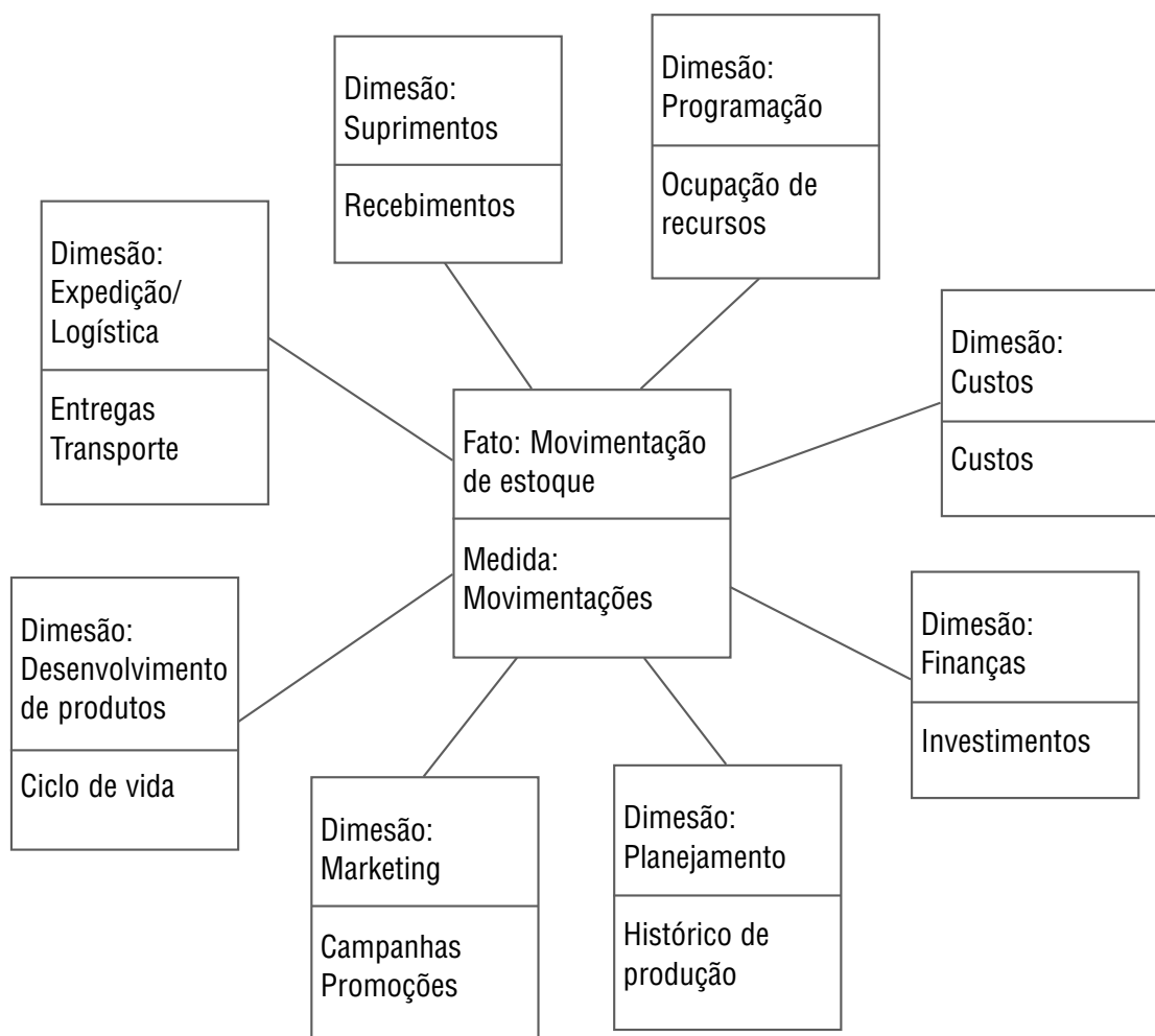
FIGURA 3 – Modelo dimensional para análise de controle de estoques.