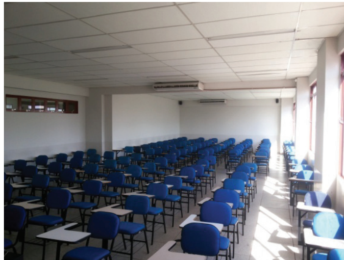
Figura 3 - Interior de uma das salas de aula do IES em estudo.

O sistema estrutural das salas de aula é em concreto armado do tipo modulado, com as estruturas dispostas em simetria perante o bloco. As esquadrias são em estrutura metálica e com vedações em vidro do tipo de correr. Nos corredores existem esquadrias do tipo Max-ar , as quais são baixas e com peitoril alto. A Figura 3 apresenta as salas caracterizadas pelo teto rebaixo em poliestireno expandido (isopor), sem acabamento, fixadas com perfis metálicos, e pés direitos variando de 3,10 e 3,13 m.